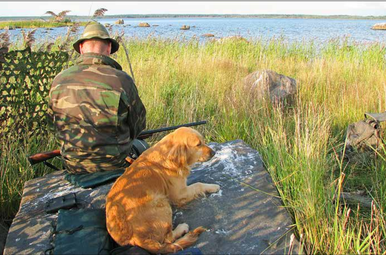
Osakaskunnan kokous päättää yhteisellä vesialueella tapahtuvasta vesilintujen metsästyksestä.